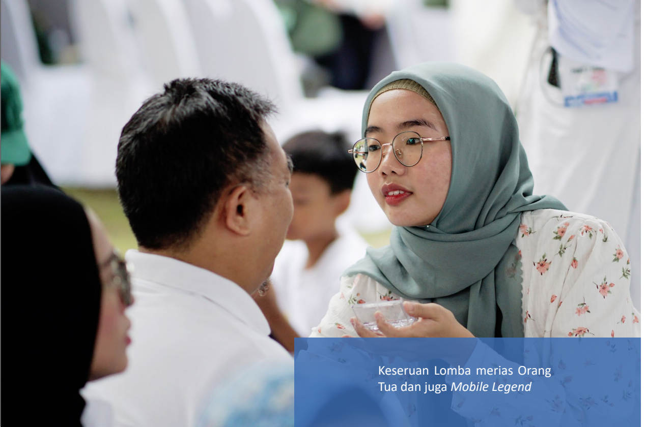
Keseruan Lomba merias Orang Tua dan juga Mobile Legend